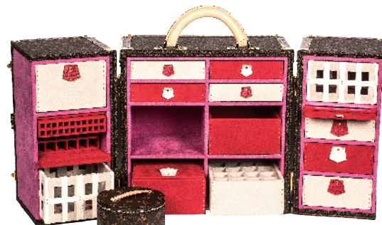
左:品酒硬箱 中:仕女梳妆硬箱 右:中国麻将旅行硬箱