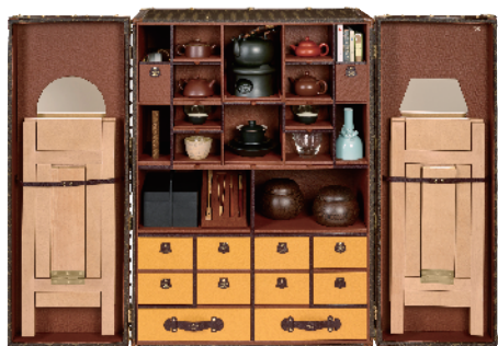
左:王德传×路易威登茶人旅行硬箱 中:陈幼坚×路易威登茶道硬箱 右:王德传品茗硬箱